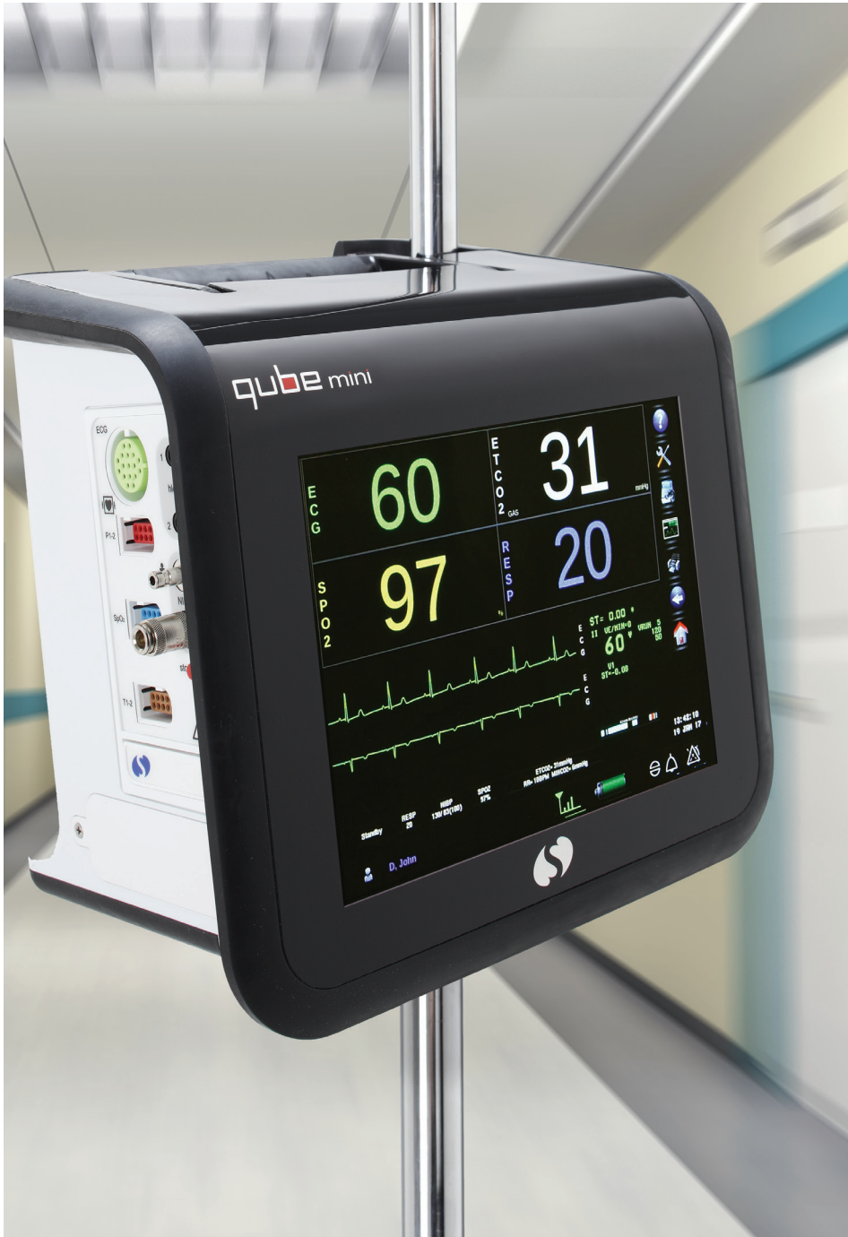
| Monitor de transporte Qube® Mini

Com o monitor de transporte de pacientes Qube® Mini, você jamais compromete o acesso aos dados de alta acuidade do paciente à beira do leito e em movimento. Otimizado para transporte, o Qube Mini garante um nível ininterrupto de vigilância para pacientes mais vulneráveis. A tela grande do Qube Mini torna os dados do paciente legíveis à beira do leito ou do outro lado do quarto.